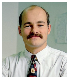
Hans König Ressort Job & Karriere Computerwoche