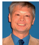
Edgar Wang Medienconsulting